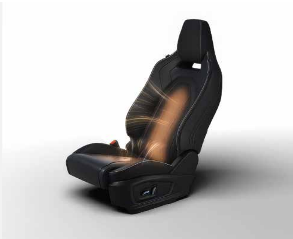
VYHŘÍVANÁ PŘEDNÍ SEDADLA S ELEKTRICKÝM NASTAVENÍM POLOHY