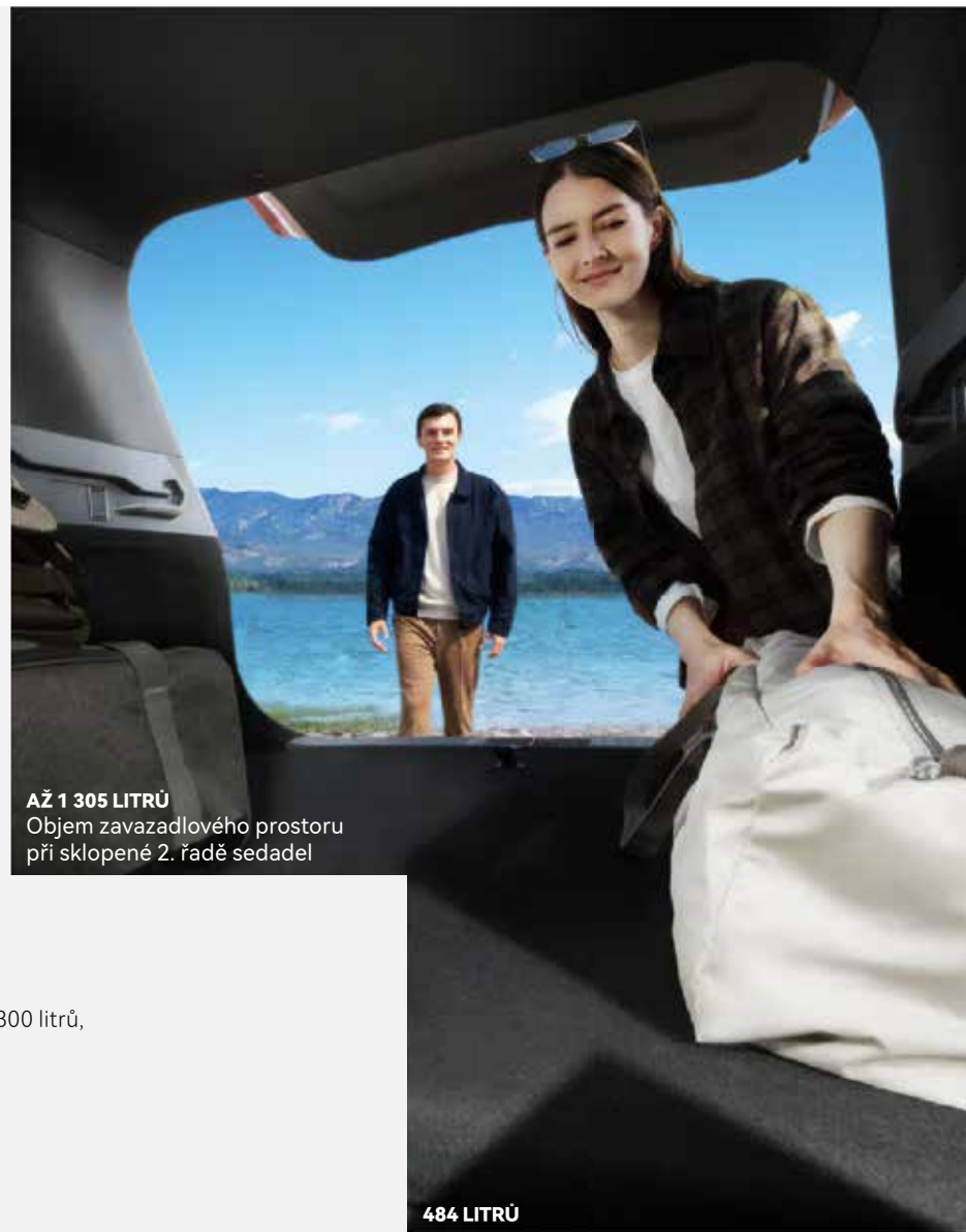
AŽ 1 305 LITRŮ Objem zavazadlového prostoru při sklopené 2. řadě sedadel