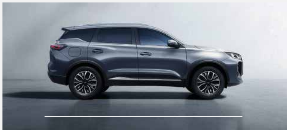
Celková délka: 4 553 mm, rozvor náprav: 2 670 mm