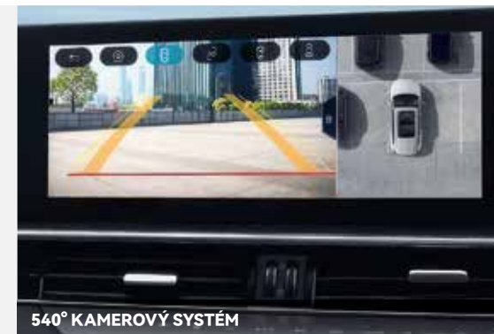
540° KAMEROVÝ SYSTÉM