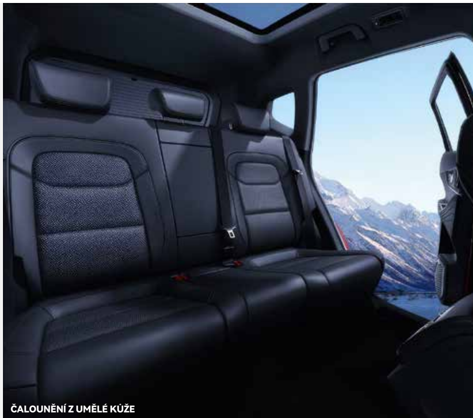
ČALOUNĚNÍ Z UMĚLÉ KŮŽE