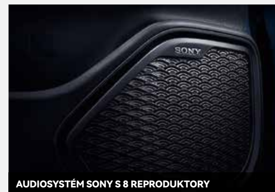
AUDIOSYSTÉM SONY S 8 REPRODUKTORY