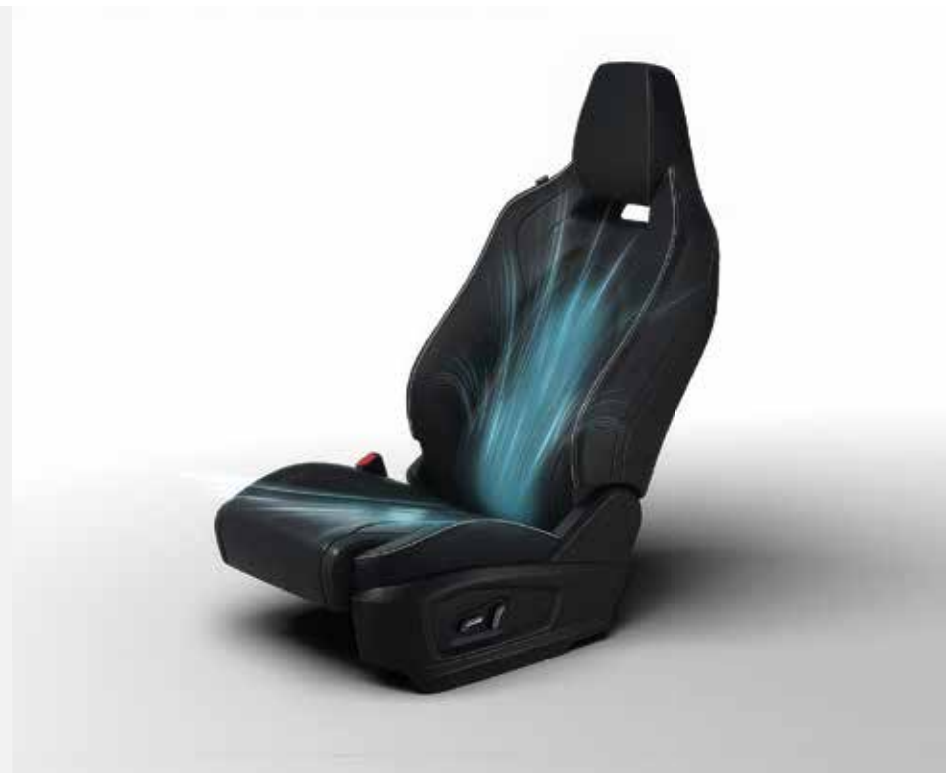
VENTILOVANÁ PŘEDNÍ SEDADLA S PAMĚTÍ POLOHY SEDADLA ŘIDIČE