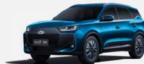
EMERALD BLUE (WE)