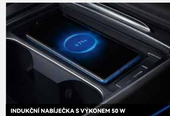
INDUKČNÍ NABÍJEČKA S VÝKONEM 50 W