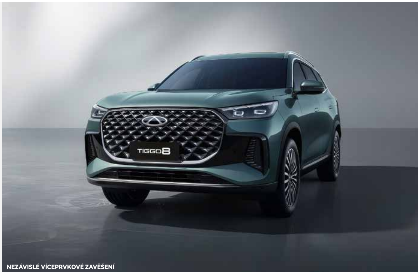
NEZÁVISLÉ VÍCEPRVKOVÉ ZAVĚŠENÍ