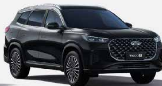
CARBON CRYSTAL BLACK (CL)