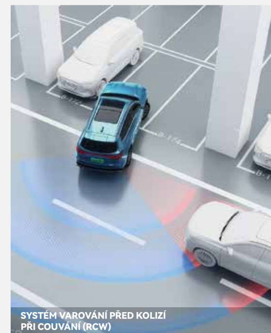
SYSTÉM VAROVÁNÍ PŘED KOLIZÍ PŘI COUVÁNÍ (RCW)

Systémy ADAS jsou součástí strategie této značky v oblasti bezpečnosti a moderních technologií. CHERY, jako výrobce vyvíjející vlastní řešení v oblasti autonomie a umělé inteligence, nabízí stále pokročilejší systémy asistence řidiče.