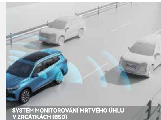
SYSTÉM MONITOROVÁNÍ MRTVÉHO ÚHLU V ZRCÁTKÁCH (BSD)