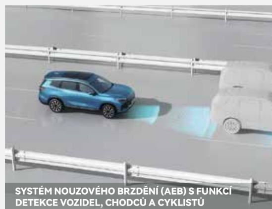
SYSTÉM NOUZOVÉHO BRZDĚNÍ (AEB) S FUNKCÍ DETEKCE VOZIDEL, CHODCŮ A CYKLISTŮ