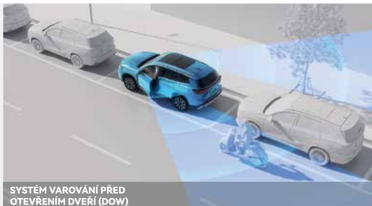
SYSTÉM VAROVÁNÍ PŘED OTEVŘENÍM DVEŘÍ (DOW)