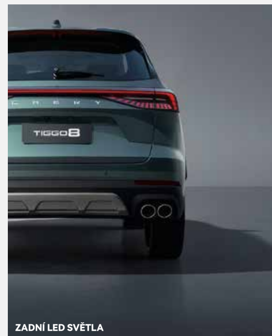
ZADNÍ LED SVĚTLA