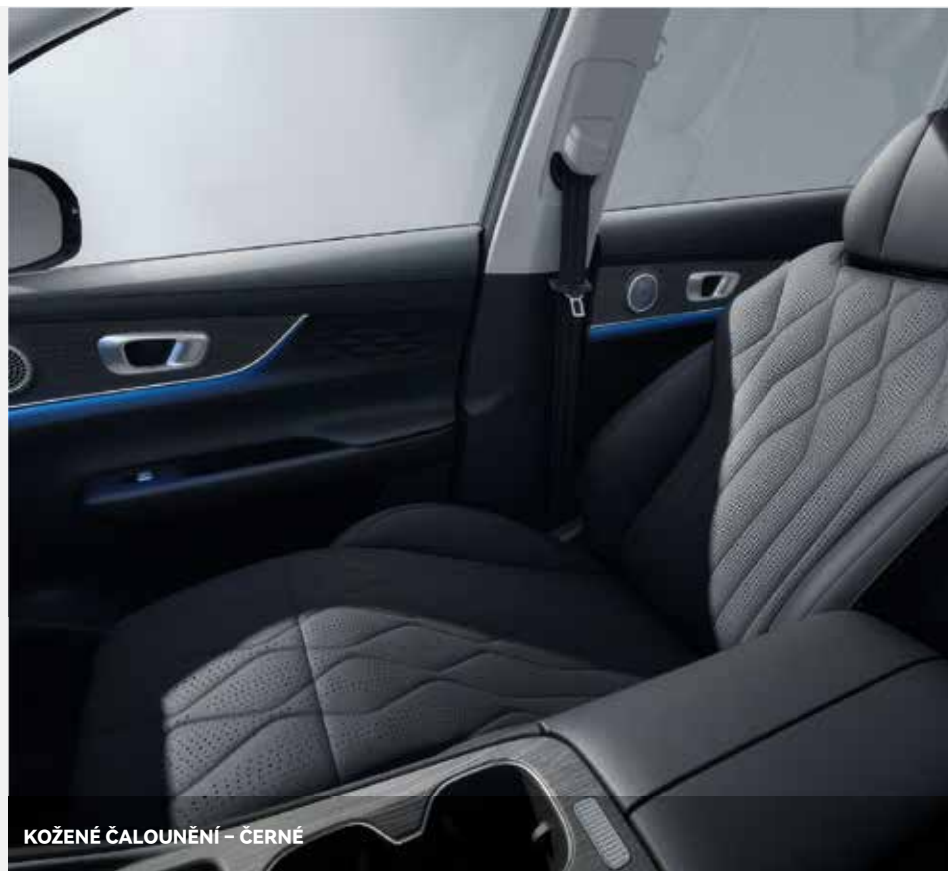
KOŽENÉ ČALOUNĚNÍ - ČERNÉ