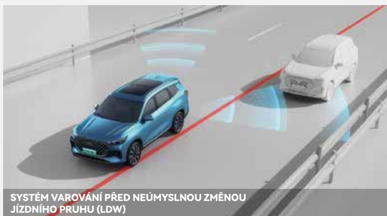
SYSTÉM VAROVÁNÍ PŘED NEÚMYSLNOU ZMĚNOU JÍZDNÍHO PRUHU (LDW)