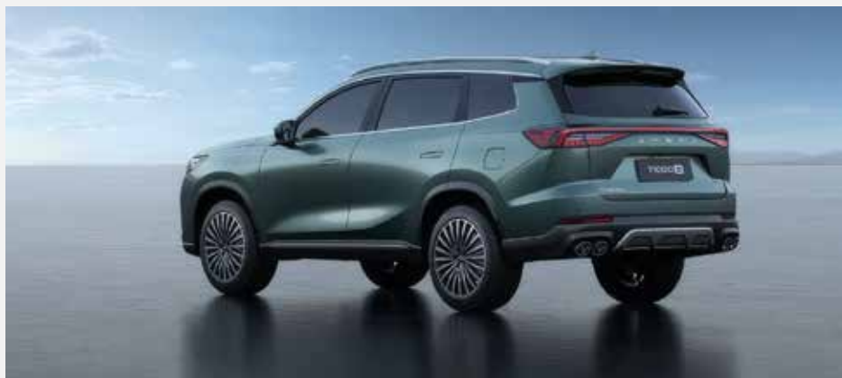
Maximální objem zavazadlového prostoru: 1 930 l (při sklopených sedadlech 2. a 3. řady)