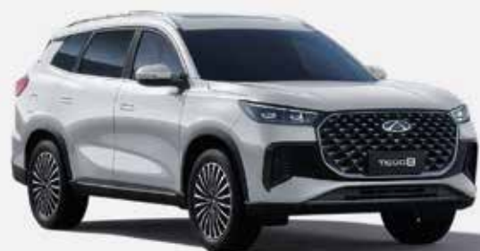
KHAKI WHITE (BW)