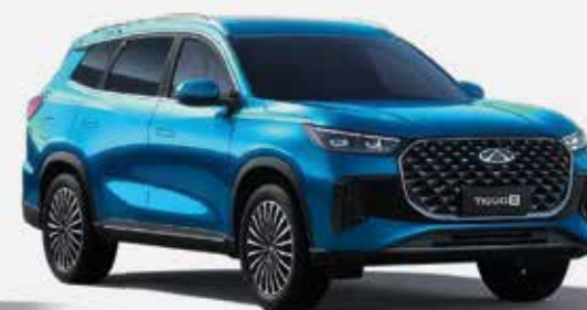
SEA BLUE (LM)