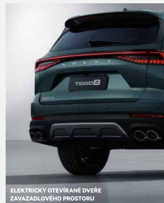
ELEKTRICKY OTEVÍRANÉ DVEŘE ZAVAZADLOVÉHO PROSTORU