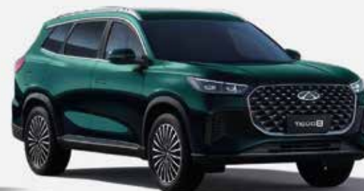
AURORA GREEN (SJ)