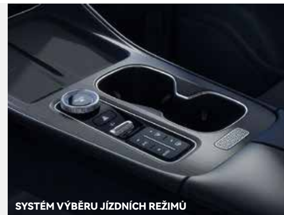
SYSTÉM VÝBĚRU JÍZDNÍCH REŽIMŮ

Pod kapotou modelu TIGGO 8 pracuje moderní čtyřválcový motor 1.6 Turbo T-GDI (Turbo Gasoline Direct Injection), vyvinutý na základě globální technologie ACTECO. Jedná se o motor, který kombinuje vysoký výkon s úsporností. Dvouspojková automatická převodovka 7DCT (Getrag) byla navržena pro ty, kteří ocení komfort automatu, ale nechtějí se vzdát dynamiky sportovního charakteru.