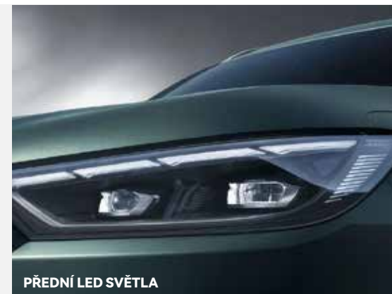
PŘEDNÍ LED SVĚTLA

Moderní, dynamický a plný charakteru – TIGGO 8 je SUV, které kombinuje elegantní linii s mohutnou siluetou. Jeho design byl vytvořen s ohledem na řidiče, kteří očekávají styl. Agresivní přední část s širokou mřížkou chladiče, ostře řezané LED světlomety a elegantní chromované detaily tvoří moderní, ale nadčasový celek.