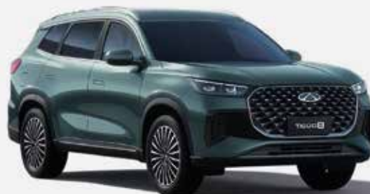
BAMBOO GRAY (UM)