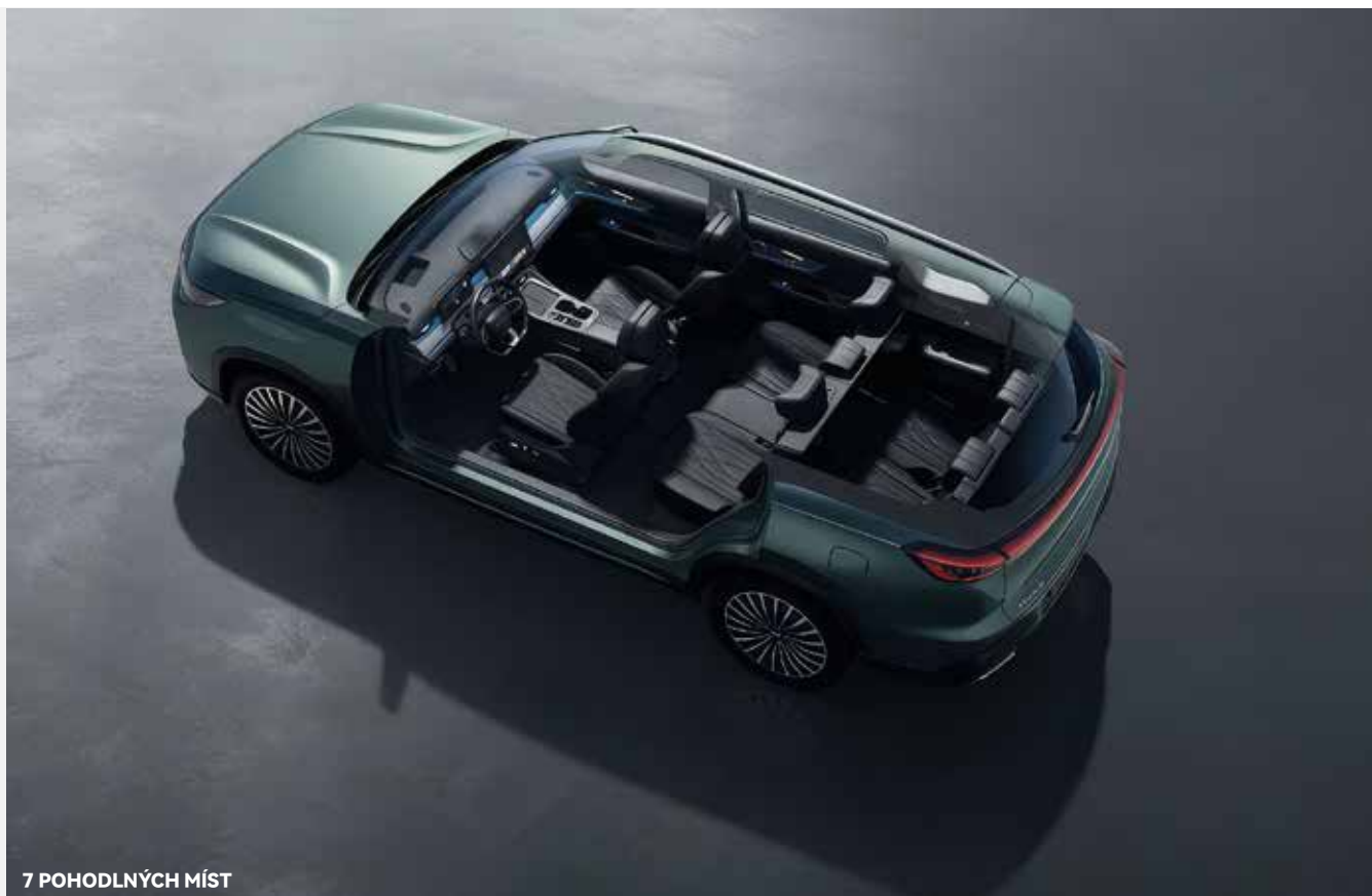
7 POHODLNÝCH MÍST