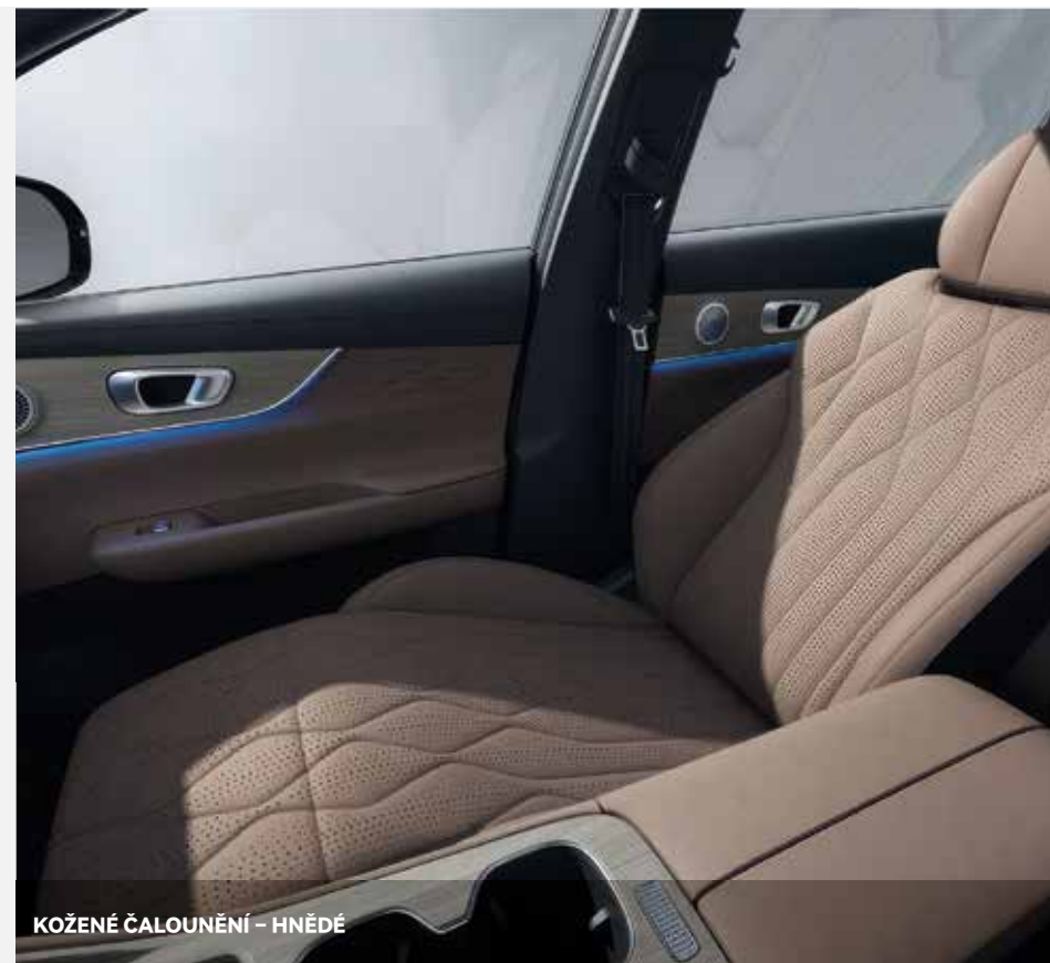
KOŽENÉ ČALOUNĚNÍ - HNĚDÉ