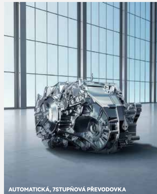
AUTOMATICKÁ, 7STUPŇOVÁ PŘEVODOVKA