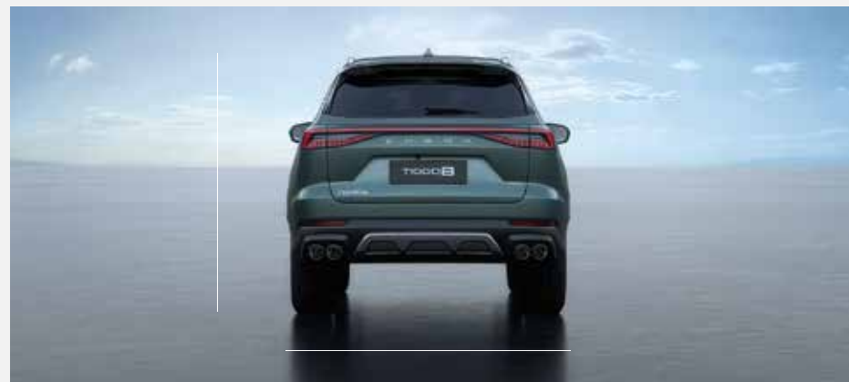
Celková šířka včetně zrcátek: 1 860 mm, celková výška: 1 705 mm