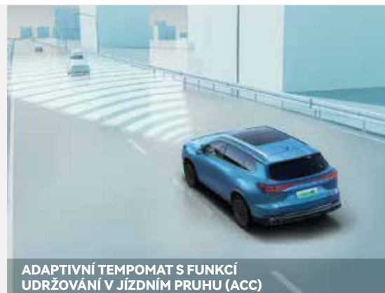
ADAPTIVNÍ TEMPOMAT S FUNKCÍ UDRŽOVÁNÍ V JÍZDNÍM PRUHU (ACC)