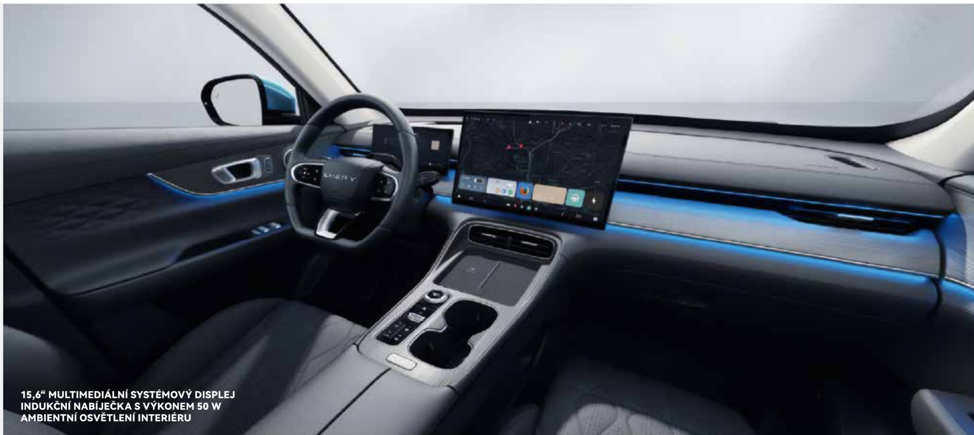
15,6" MULTIMEDIÁLNÍ SYSTÉMOVÝ DISPLEJ INDUKČNÍ NABÍJEČKA S VÝKONEM 50 W AMBIENTNÍ OSVĚTLENÍ INTERIÉRU