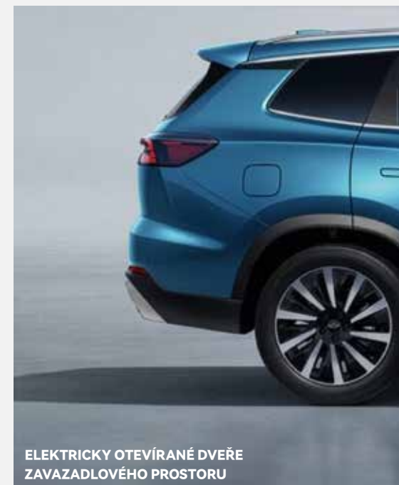
ELEKTRICKY OTEVÍRANÉ DVEŘE ZAVAZADLOVÉHO PROSTORU