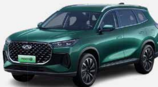
AURORA GREEN (SJ)