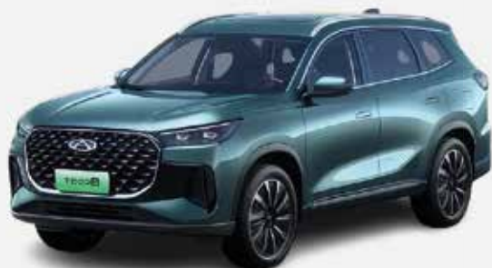
BAMBOO GRAY (UM)