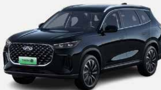
CARBON CRYSTAL BLACK (CL)