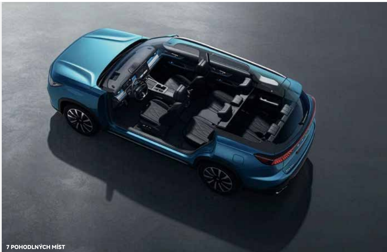
7 POHODLNÝCH MÍST