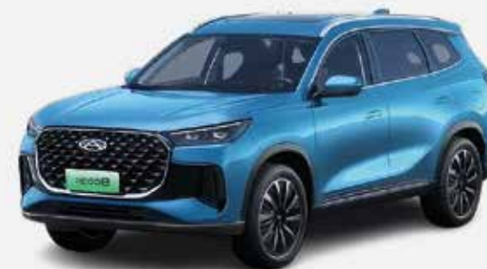
SEA BLUE (LM)