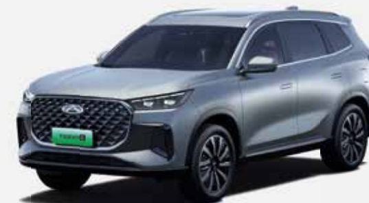
BASALT GRAY (UV)